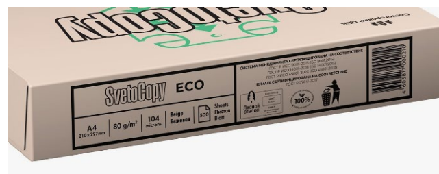
Канцелярская бумага SvetoCopy ECO