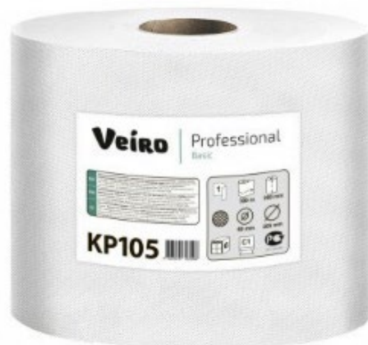
Полотенца бумажные с добавлением макулатуры