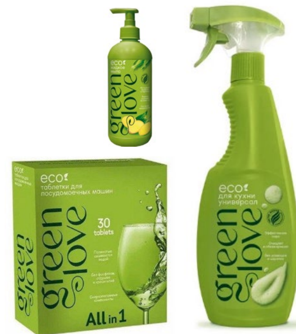
Бытовая химия Green Love